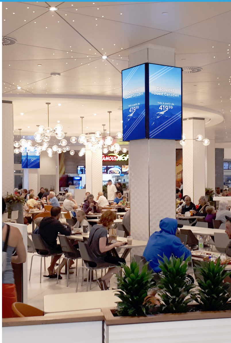
Positionné dans les aires de restauration

Ce document couvre les spécifications techniques à respecter pour la production d'un affichage publicitaire numérique vertical. Vous y retrouverez les meilleures pratiques pour la création d'un visuel efficace et attrayant, les types de fichiers à envoyer à notre équipe pour le montage de vos publicités en vidéo "full-motion" et les instructions pour le téléchargement de vos visuels sur notre page WeTransfer.