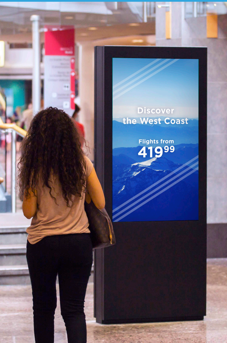
Positionné dans les aires communes